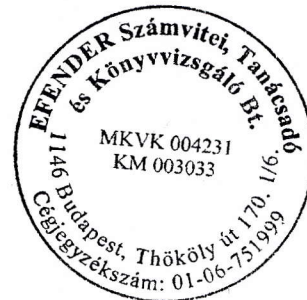
Flender Éva kamarai tag könyvvizsgáló (006535)