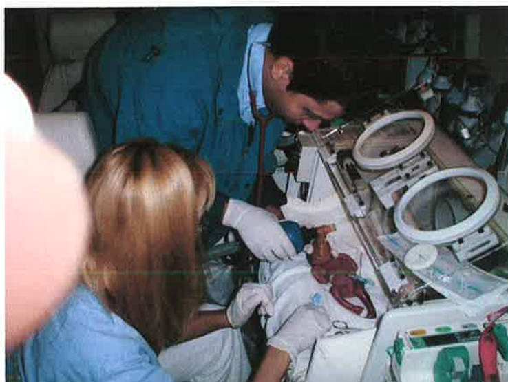
Állapotstabilizálás a mentőautóban

Szülészobai vagy más helyszínen történő újraélesztést 1373 alkalommal végeztünk, és azt 90%-ban sikeresen fejeztük be. Az általunk ellátott területen a születés körüli halálozás közel 12 %-kal csökkent.