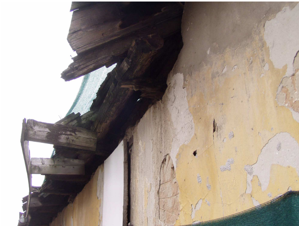
Tönkrement födémgerenda és szarufa