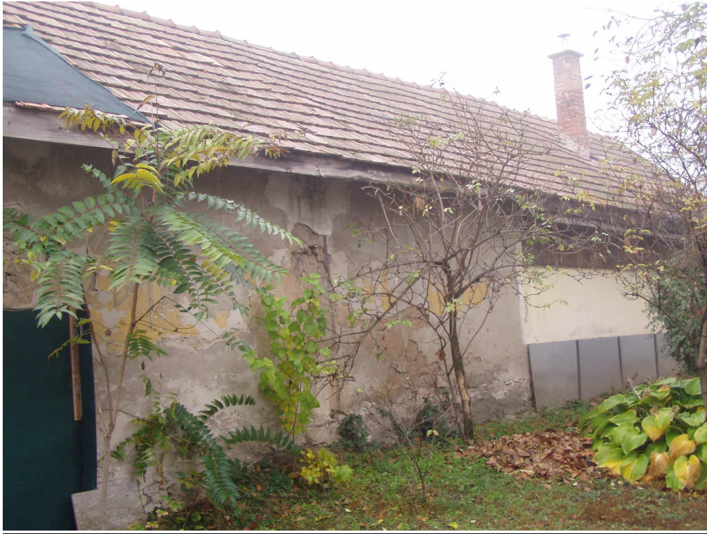
Leázott hátsó főfal