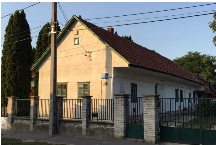
7. Sváb népi lakóház – Baross tér 6.