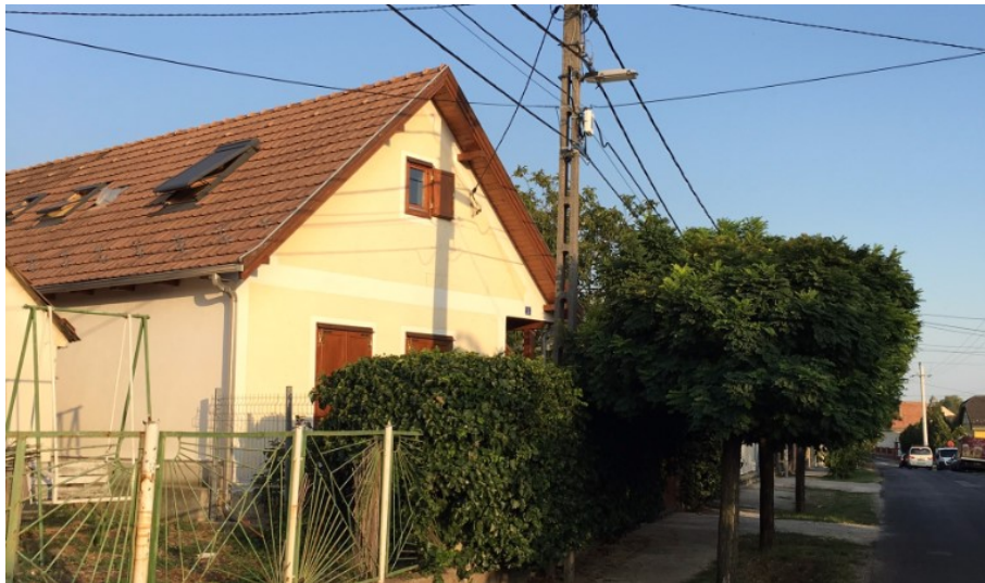
11. Sváb népi lakóház – Széchenyi utca 35.