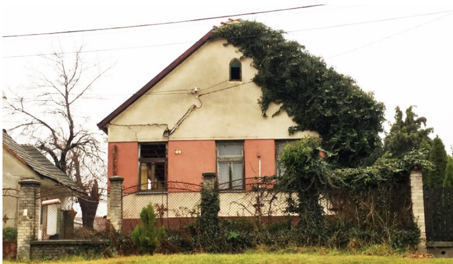
6. Sváb népi lakóház – Plébánia tér 3.