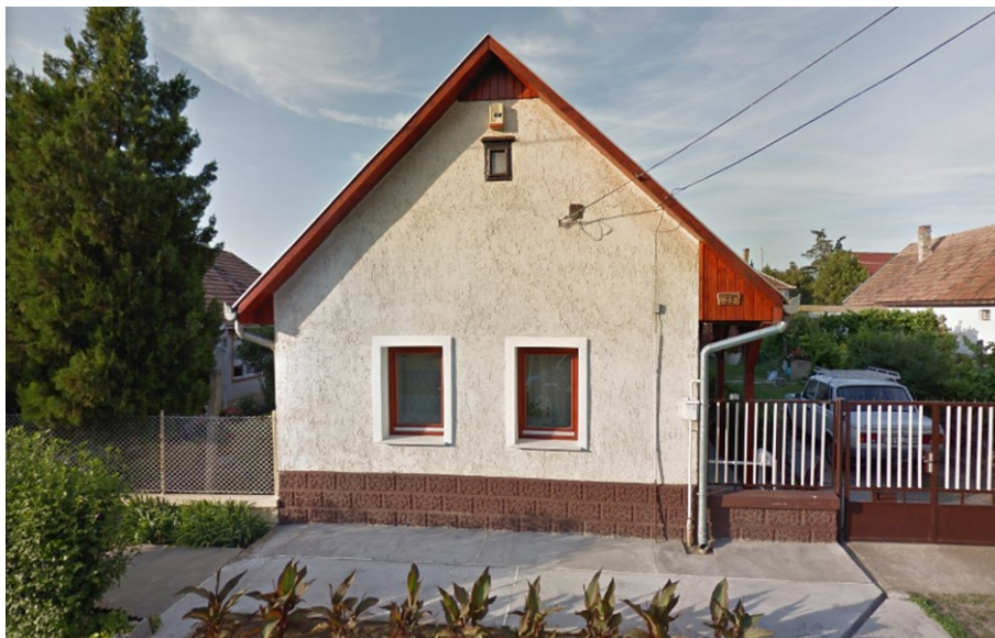
14. Sváb népi lakóház – Szent Mihály utca 25.