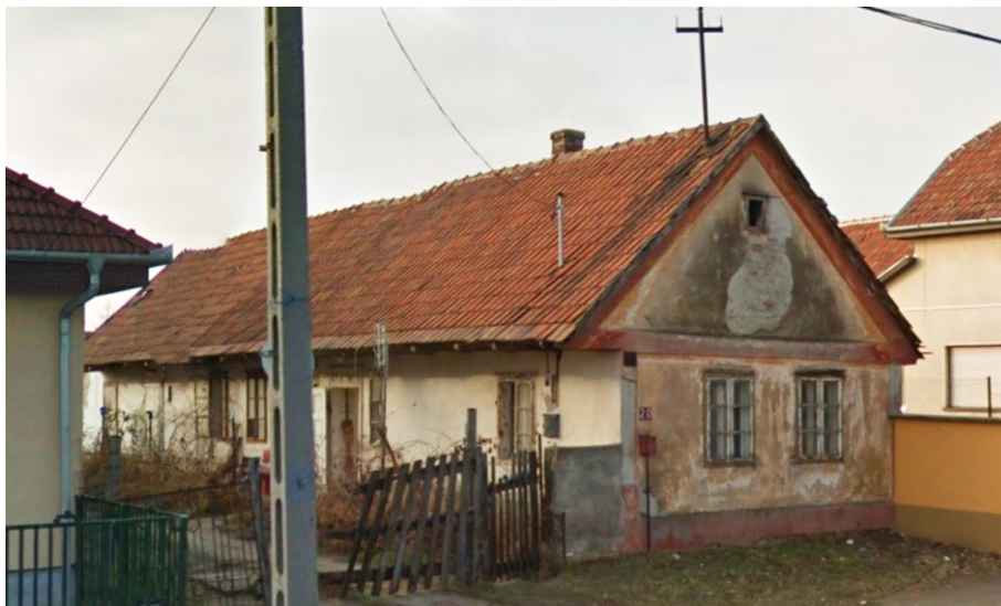
8. Sváb népi lakóház – Szent Imre utca 20.