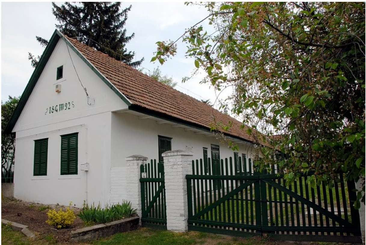
2. Tájház (sváb népi lakóház, Heimatmuseum) – Dózsa György utca 52.