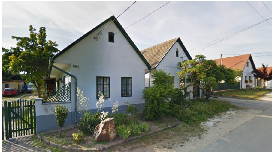
3-5. Sváb népi lakóházak – Dózsa György utca 39-41.