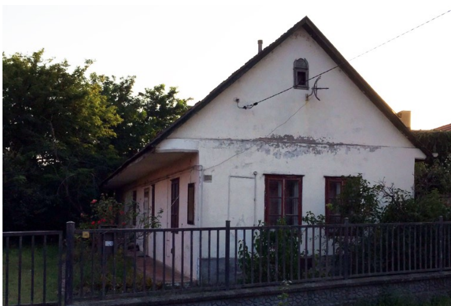
10. Sváb népi lakóház – Széchenyi utca 34.