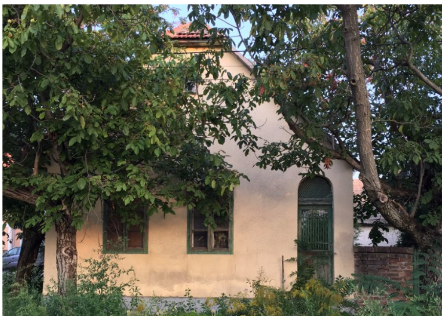
15. Sváb népi lakóház – Arany János utca 14.