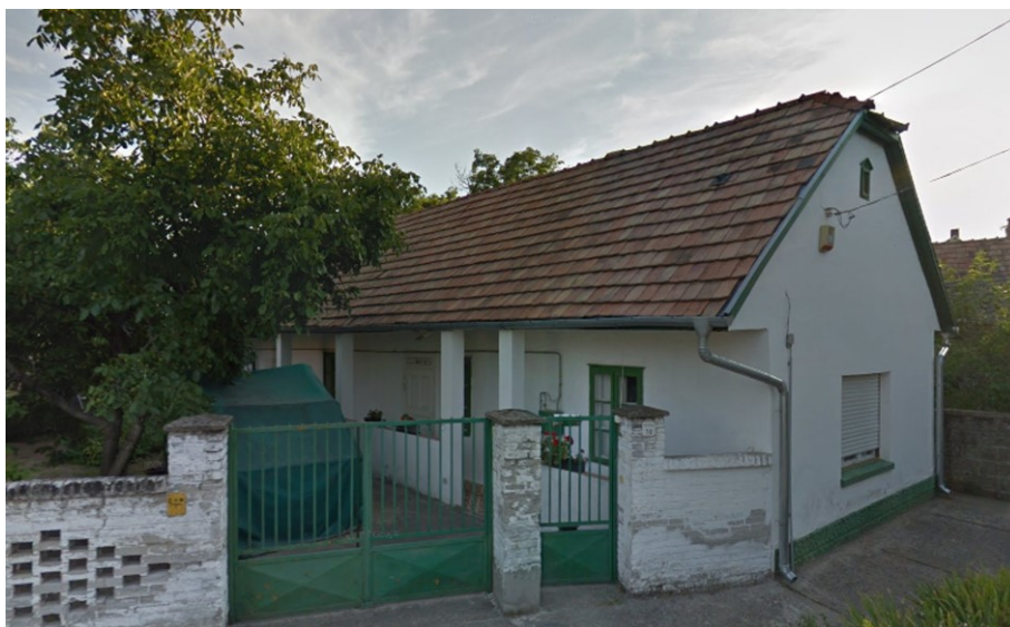
13. Sváb népi lakóház – Szent Mihály utca 16.