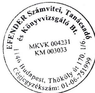
Flender Éva kamarai tag könyvvizsgáló (006535)