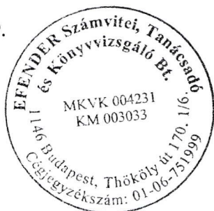
Flender Éva kamarai tag könyvvizsgáló (006535)